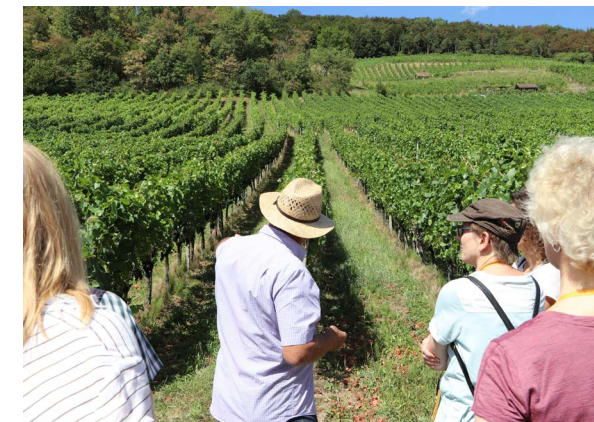
Besucherinnen erfahren an der Weinwanderung im Schenkenbergtal Wissenswertes zum Rebbau im JPA