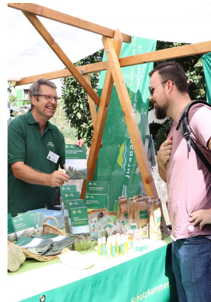
Beratung von Interessierten am Pfalz-Märt in Veltheim