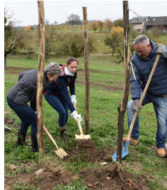
Anpacken bei der Pflanzaktion: Raiffeisen Mitarbeitende setzen 20 Hochstamm-Äpfelbäume