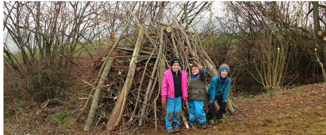
Glücklich nach getaner Arbeit – die Schülerinnen und Schüler der Schule Gansingen, die am Wiesel-Schulmodul teil nahmen

Auf 23 verschiedenen Land- und Forstwirtschaftsbetrieben sowie in einem Fall in Zusammenarbeit mit einer Gemeinde leisteten im Berichtsjahr Firmenteam mit insgesamt 402 Teilnehmenden total 20 Tageseinsätze. Die meisten Anfragen liefen über die Koordinationsstelle des Netzwerk Schweizer Pärke. Die Teams halfen tatkräftig bei der Kirschenernte, der Heckenpflege, dem Eindämmen von Neophyten und Herbstzeitlosen sowie der ökologischen Aufwertung von Rebbergen mit und wurden anschliessend mit regionalen Köstlichkeiten verpflegt. Die Einsätze erfreuten sich sowohl bei den Teilnehmenden als auch bei den Einsatzbetrieben wiederum grosser Beliebtheit.