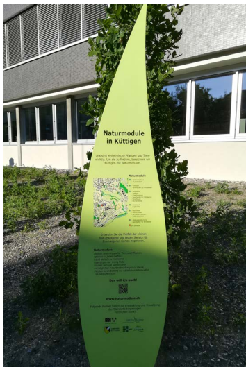
Tafeln zu den Naturmodulen in Küttigen

Auf Initiative und dank dem grossen Engagement der Natur- und Landschaftskommission Küttigen wurden an fünf Standorten in der Gemeinde verschiedene Naturmodule realisiert: Auf gemeindeeigenen Flächen haben die Beteiligten kleine Lebensräume für Schmetterlinge, Wildbienen sowie andere Pflanzen und Tiere im Siedlungsraum und Naturerlebnis-Orte für den Menschen geschaffen. Im Mai 2018 fand die Einweihung für die Bevölkerung statt. Die von Jardin Suisse und dem Kanton Aargau konzipierten Naturmodule zeigen auf, wie sich Ideen zur Biodiversitätsförderung einfach verwirklichen lassen und erst noch schön aussehen. Der JPA hat sich finanziell an der Realisierung beteiligt.