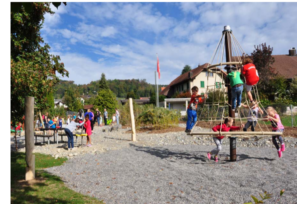
Neu gestalteter Spielplatz in Auenstein

Die Gemeinde Auenstein hat die Aufwertung und Neugestaltung des bestehenden Spielplatzes in Zusammenarbeit mit einem externen Büro beim Schulhaus geplant und realisiert. Entstanden ist ein vielseitiger Naturspielplatz mit Kiesflächen und einheimischen Sträuchern sowie einem Weidenhaus. Akazienholz aus dem JPA, vom Forstbetrieb Auenstein-Ruppertswil, konnte für gewisse Spielplatzelemente verwendet werden. Auch eine Perimuk-Federwippe ist für die Kinder zum Herumtoben da. Der JPA unterstützte die Gemeinde beratend und finanziell.