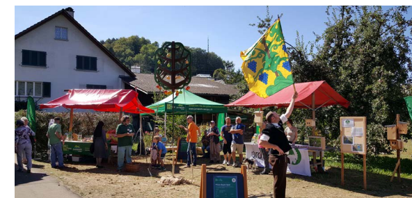
JPA-Auftritt am Dorffest Zeiningen

Das Jurapark-Fest war mit dem Jurapark-Markt dieses Jahr Teil des dreitägigen Dorffestes in Zeiningen. Das vom lokalen OK in Zusammenarbeit mit unzähligen Freiwilligen auf die Beine gestellte Fest lockte rund 18'000 Besucher in das ehemalige Bauerndorf nahe Möhlin. 52 Marktstände mit Handwerks- und Esswaren, verteilt über das Festgelände, bereicherten das Fest.