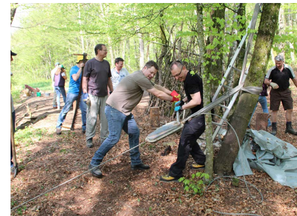
Corporate Volunteering-Einsatz: Ein Team der UBS räumt Sturmschäden von «Burglind» auf.