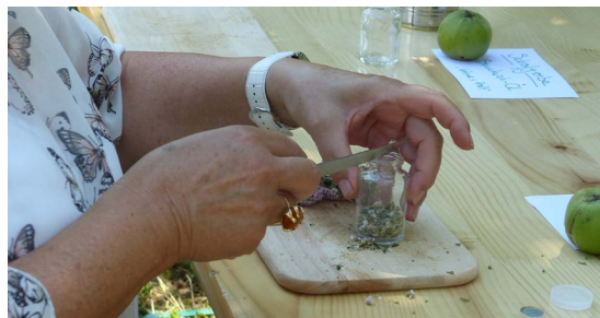
Herstellen von Schafgarbe-Öl am Tag der Landschaftsmedizin