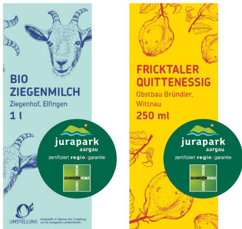
Die neuen Etiketten für zertifizierte Jurapark-Produkte