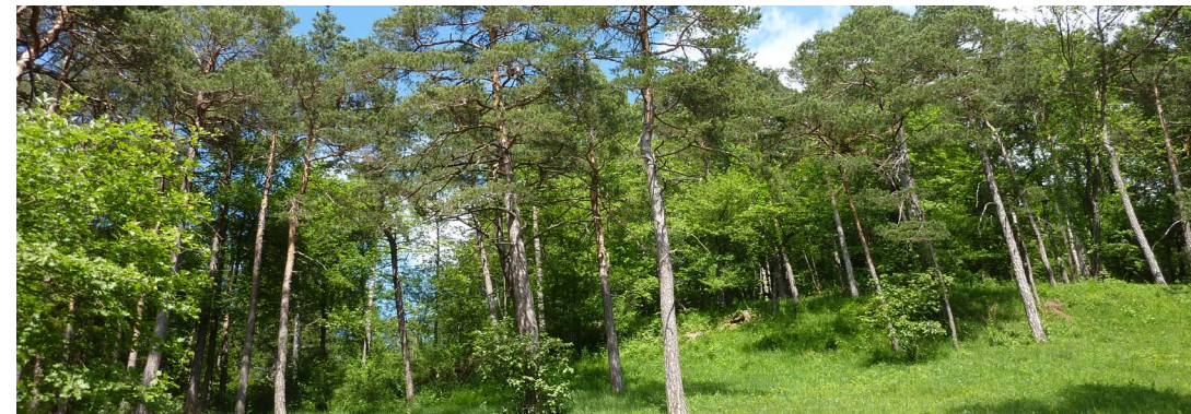
Lichter Föhrenwald in Linn