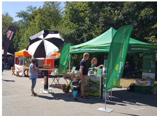
JPA-Auftritt am slowUp in Brugg

Die Website verzeichnete im Berichtsjahr rund 342'000 Seitenaufrufe von 69'000 Nutzern. Sie wird stetig aktualisiert und punktuell optimiert. 2018 kamen die Rubriken «Barrierefrei» und «Kulturschätze» hinzu.