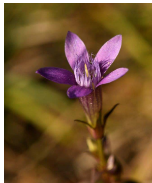
Deutscher Enzian