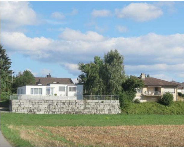
Bauprojekte am Siedlungsrand Im Bewilligungsverfahren kann Einfluss genommen werden. So lassen sich z.B. wuchtige Stützmauern und störende Terrainveränderungen vermeiden.

Eine Schlüsselrolle für hochwertige Übergangsbereiche zur Landschaft kommt Bauprojekten und Veränderungen an den Freiräumen auf Grundstücken zu, welche an oder in der Nähe von Siedlungsändern liegen.