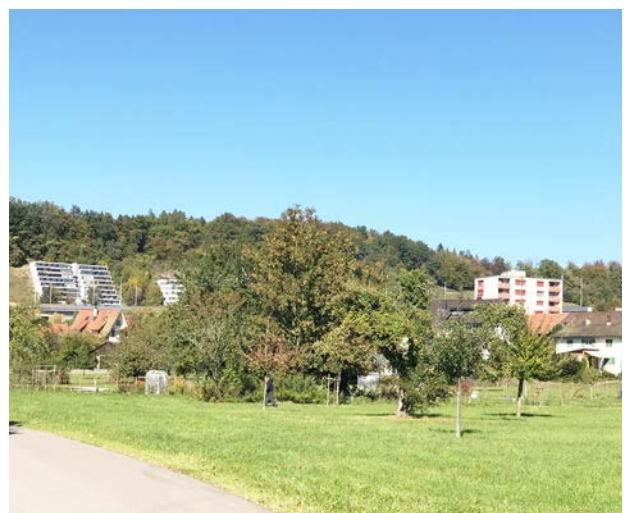
Synergiemöglichkeiten im Übergangsbereich von Landschaft und Siedlungsraum Multifunktionaler Siedlungsrand mit Schrebergärten, Obstgärten und landwirtschaftlicher Nutzung.

Mit dem Programm „Landwirtschaft – Biodiversität – Landschaft (Labiola)“ fördert der Kanton Aargau solche gemeinwirtschaftlichen Leistungen der Landwirtschaft im Kulturland. Der Landwirt kann so auf freiwilliger Basis verschiedene Massnahmen im Bereich der Biodiversität und der Landschaftsqualität in einem Bewirtschaftungsvertrag integrieren. Sinnvollerweise werden solche Elemente auch an Siedlungsändern angelegt.