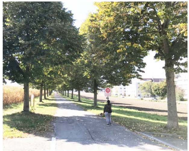
Wegangebote schaffen Lebensqualität Neugestalteter Siedlungsrand mit integriertem Wanderweg

Häufig führen deshalb Fuss- und Flurwege entlang der Siedlungsränder. Entstehen neue Projekte in diesen Übergangsbereichen, empfiehlt es sich, das übergeordnete Wegnetz genau zu untersuchen, fehlende Wegabschnitte zu schliessen und für die Bevölkerung neue Wegangebote zu prüfen. Die Zugänglichkeit und Durchlässigkeit spielen eine zentrale Rolle. Zu klären ist die Frage, wie man von der Siedlung und ihren Freiräumen in das offene Kulturland gelangt und wie die Freiräume ins Fusswegnetz eingebunden sind. Ausgewählte Siedlungsränder können in das kommunale Fuss- und Wanderwegnetz integriert und gestalterisch aufgewertet werden (z.B. mit wegbegleitenden Alleen, Baumgruppen oder Heckenelementen).