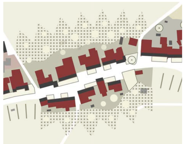
Räumliches Entwicklungsleitbild der Gemeinde Bözberg Das REL der Gemeinde Bözberg definiert einen breiten Übergangsbereich zwischen der historischen Häuserzeile und der offenen Landschaft