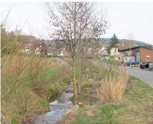
Revitalisierung von Fliessgewässern am Siedlungsrand Bachöffnung aufgrund der Bautätigkeiten mit neuer Kanalisationserschliessung. Ergebnis: attraktives Landschaftsbild, neuer Lebensraum als Fliessgewässer, verbesserte Vernetzung, gesteigerte Naherholung für die Bevölkerung.

Oftmals wird der Bauzonenrand nicht als ein eigenständiges Siedlungsrand-Projekt behandelt und gestaltet. Vielmehr gibt es verschiedene Gelegenheiten bei anderen Bauprojekten, die zur Aufwertung des Siedlungsrandes genutzt werden können. Eine dieser Möglichkeiten ist, eingedolte Gewässer wieder zu öffnen und revitalisieren.