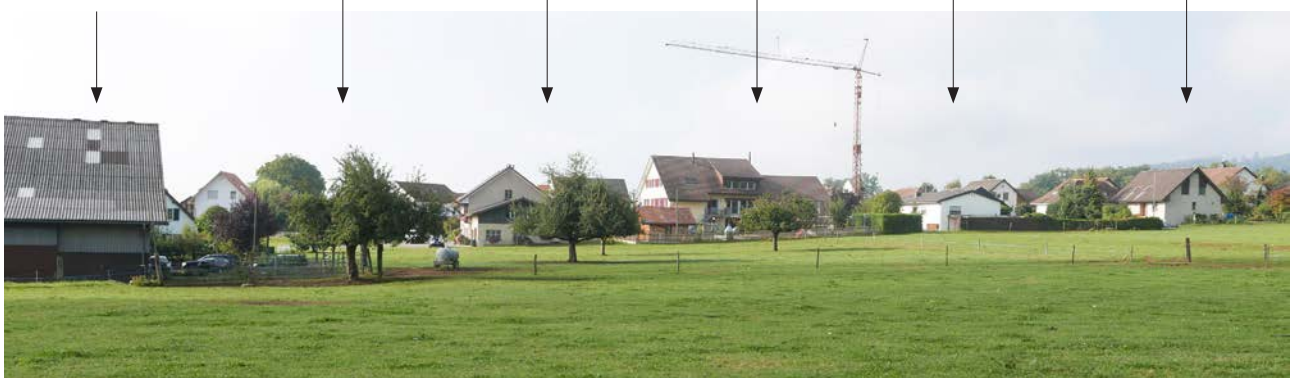
Einflussfaktoren auf die Prägung und Gestaltung der Siedlungsränder

f) Gesellschaftliche, soziale Bedeutung, Begegnungsraum