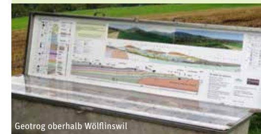
Geotrog oberhalb Wölflinswil

www.bergwerkherznach.ch / www.bergwerksilo.ch Tel. +41 (0)62 878 15 11 info@bergwerkherznach.ch